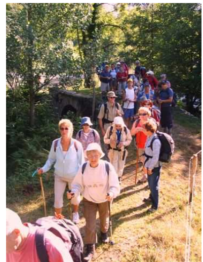
Marche Saint- Jacques juillet