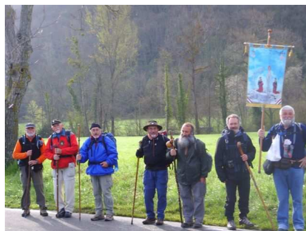
Sur la route

Ces pèlerins étaient partis le 15 Février de Savona (près de Gênes) pour arriver à Lourdes le 4 avril. C'est par le site internet qu'ils ont eu connaissance du chemin de Piémont dont ils nous ont fait le meilleur éloge.