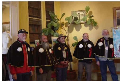
Réception à Saint-Lizier