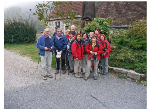
Vallée du Célé